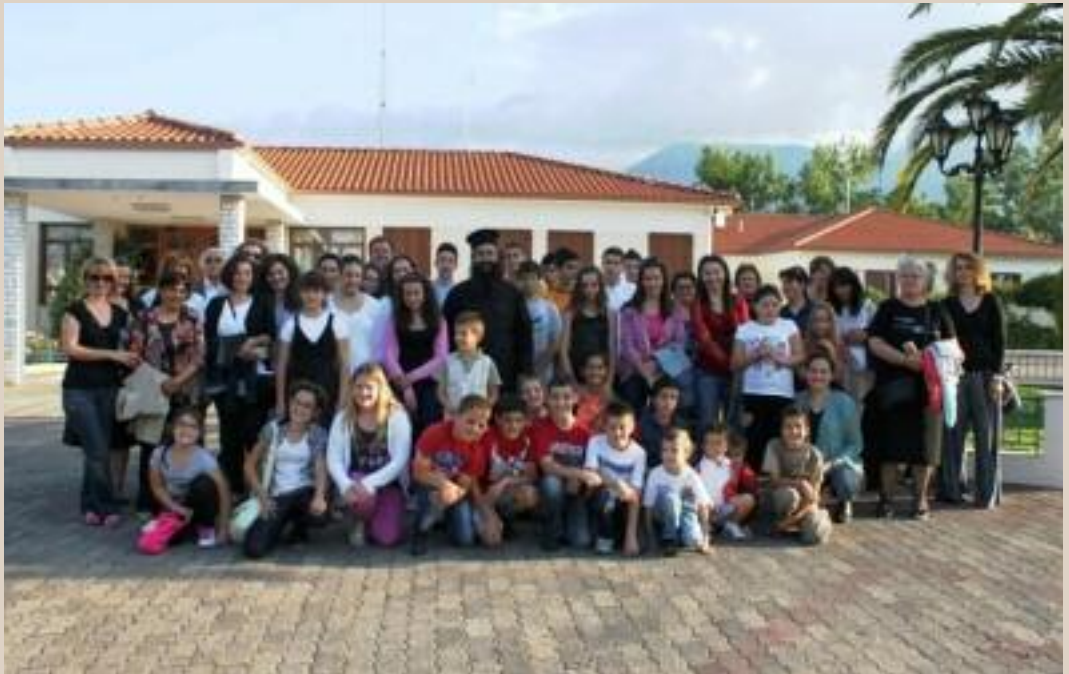
Από την επίσκεψη του Κατηχητικού Σχολείου Μυρτέας στο Άσυλο Ανιάτων Σπάρτης