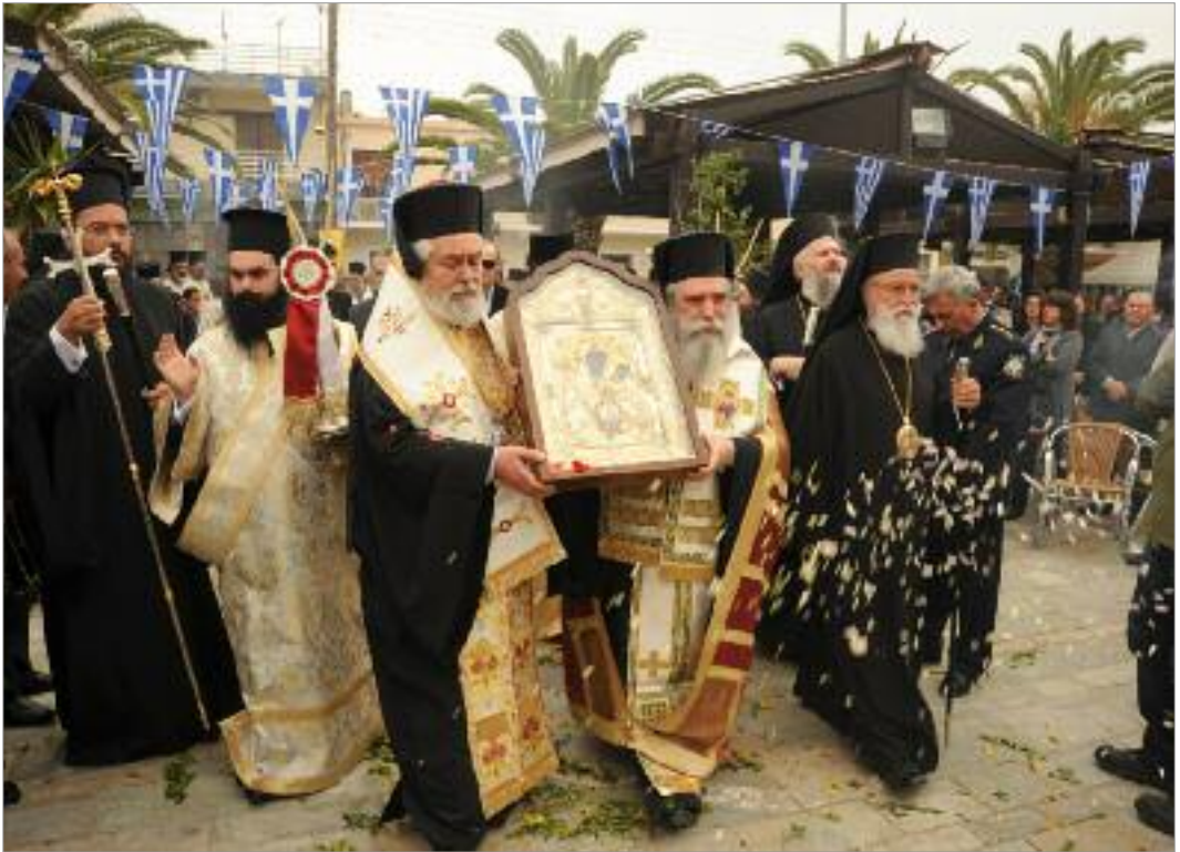
Από την ύποδοχή τῆς Ἱερᾶς Εἰκόνας Παναγίας Ἐλωνας στό Βλαχιώτη (06-04-2013)