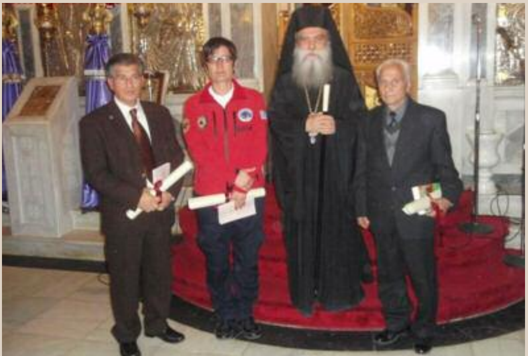
Από τις τιμητικές βραβεύσεις στον τελευταίο Κατανυκτικό Έσπερινό (21-04-2013)