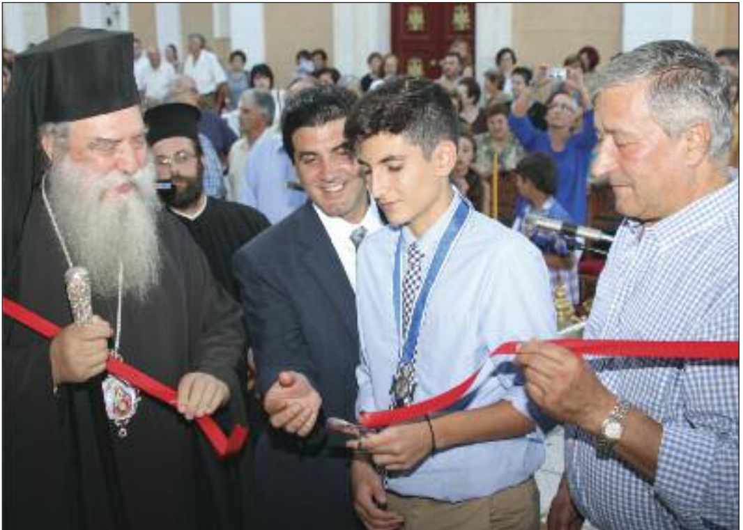
Άπο τὰ ἐγκαίνια τοῦ Πνευματικοῦ Κέντρου τῆς ἐνορίας Παλαιοπαναγιάς (10/7/2016)