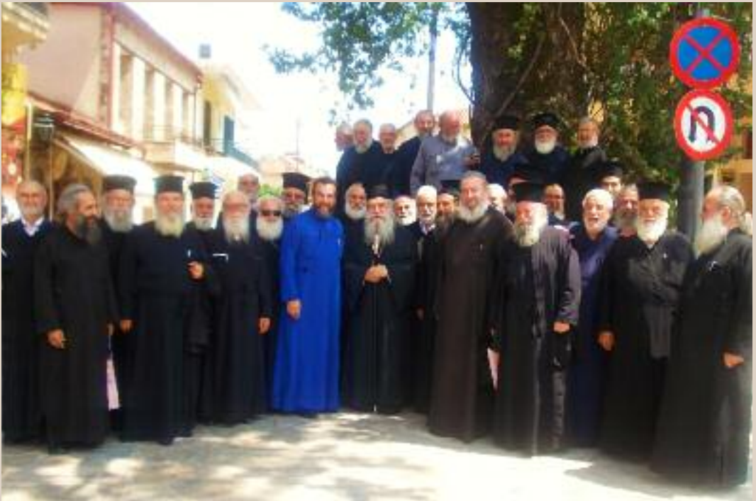
Από την 34η Πανελλήνια Συνάντηση Ιεροδιδασκάλων πού πραγματοποιήθηκε στο Μυστρά (6/7/2016)