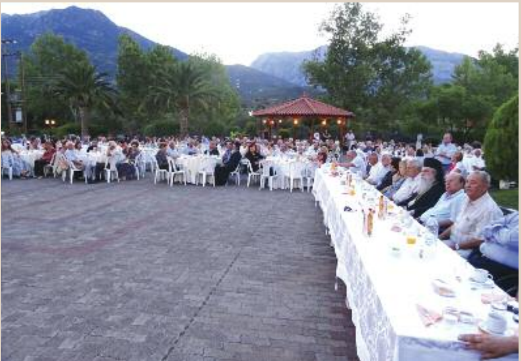
Από την τιμητική εκδήλωση για τούς όμογενείς (Άσυλο Ανιάτων 18/8/2016)